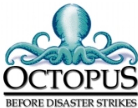
Octopus: Ein Tintenfisch als Verfügbarkeitsgarant

Octopus HA+ ist eine durchaus praxistaugliche Lösung, um die Verfügbarkeit von NT-Servern für Datei- und Datenbankanwendungen zu erhöhen. Enttäu-